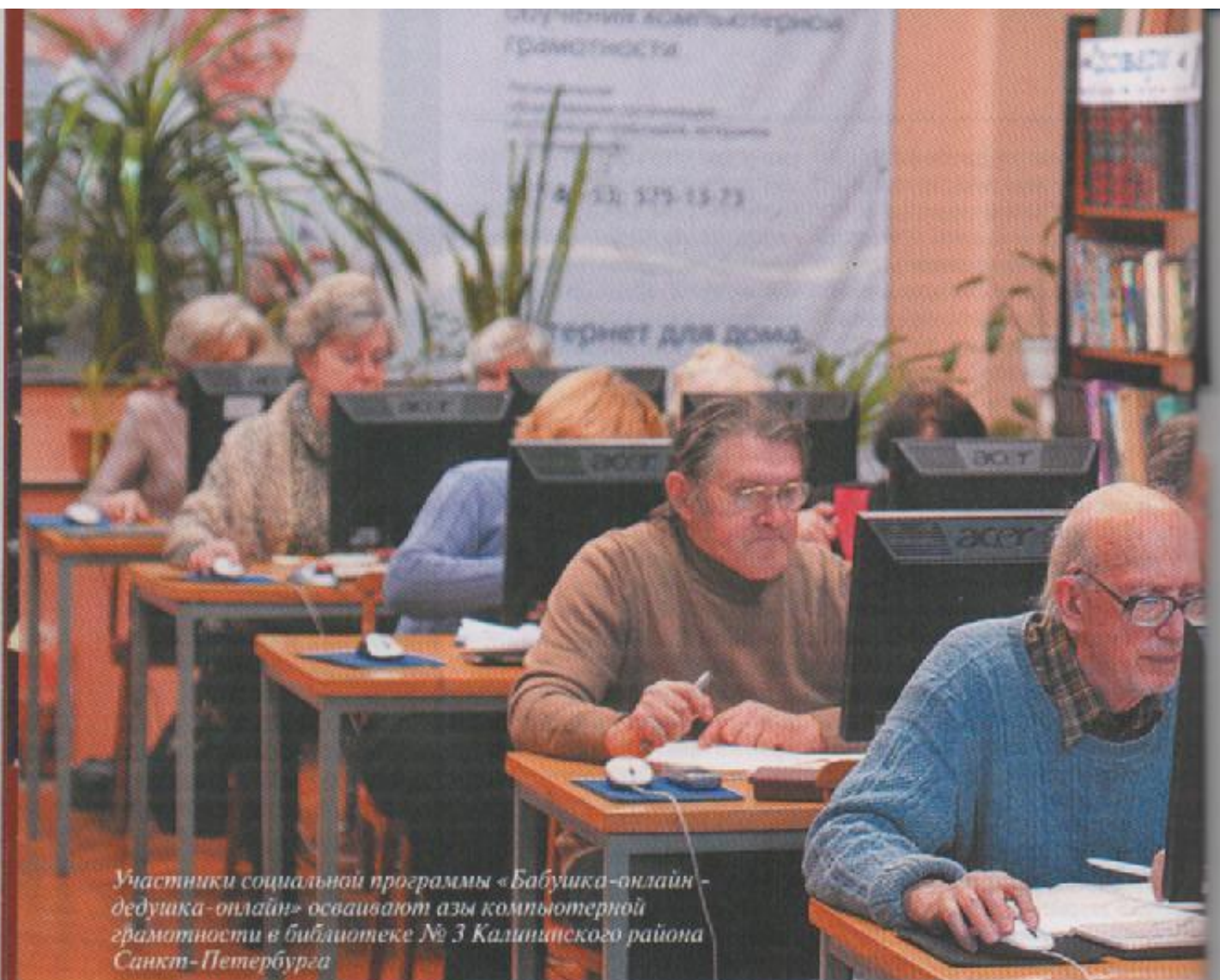
Участники социальной программы «Бабушка-онлайн - дедушка-онлайн» осваивают азы компьютерной грамотности в библиотеке № 3 Калининского района Санкт-Петербурга

нашего-банипала, учредителя первой известной человечеству библиотеки. Присмотревшись внимательно, мы увидим, что принципиально в библиотеке за почти 3000 лет ничего не изменилось. Как и раньше, человеческие знания зафиксированы на носителях (правда, вместо глиняных табличек нынче на дворе электронные файлы), а носители для удобства поиска одинаково подписаны и распределены по разделам (раньше - залы, теперь - директории). Конечно, добавились объемы и разнообразие информации, быстрое действие поисковых машин, но это не имеет прямого отношения к принципу библиотеки. Комплектование, обработка и предоставление информации как были, так и остаются базовыми